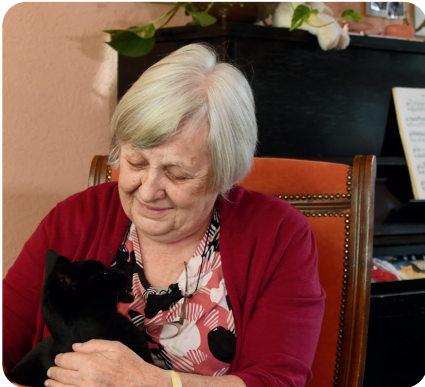
Mevrouw van de Walle, 78 jaar

"Ik wil nog niet aan de rollator en daarom wilde ik aan mijn spieren gaan werken. Nu ik thuis beweeg met Fyln merk ik verbetering. Mijn houding is verbeterd en mijn lopen is verbeterd. Mijn piano, die al 20 jaar ongebruikt in de kamer stond, gebruik ik zelfs weer. Ik gebruik de toetsen om oefeningen met mijn vingers te doen."